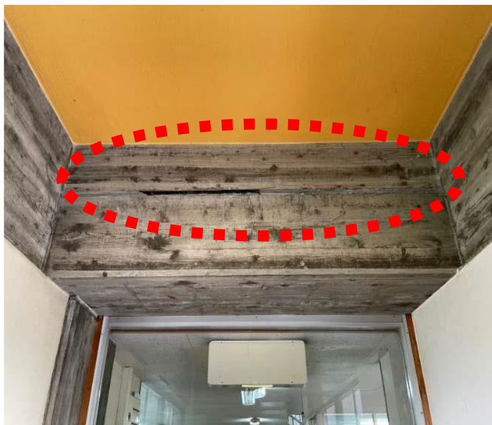
2階入り口梁の クラック（ひび割れ）