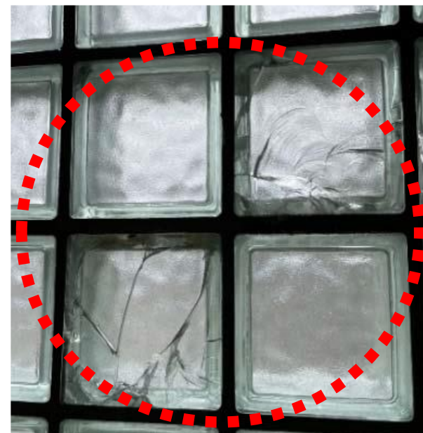
ガラスブロックの 破損