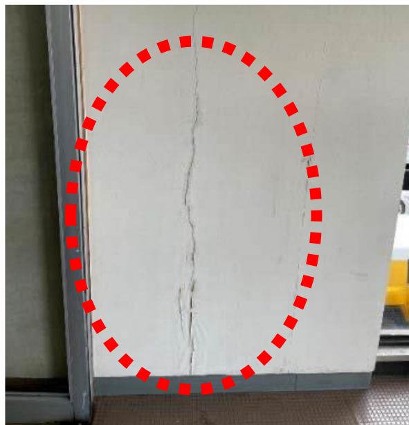
2階入り口壁の クラック（ひび割れ）