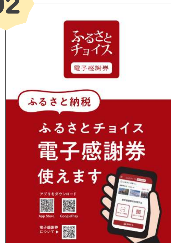
掲示用ポスター（A4サイズ）