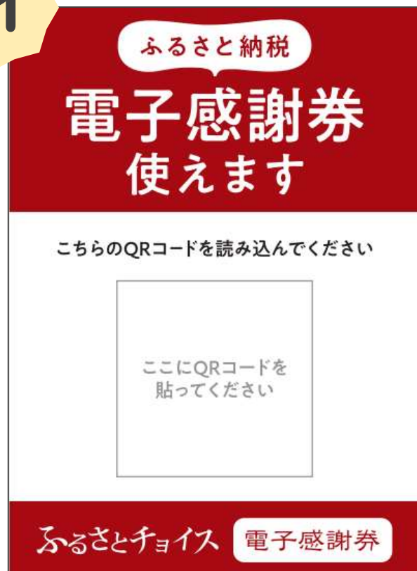
決済用QRコード（A6サイズ）