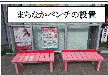
まちなかベンチの設置