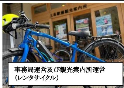
事務局運営及び観光案内所運営 (レンタサイクル)