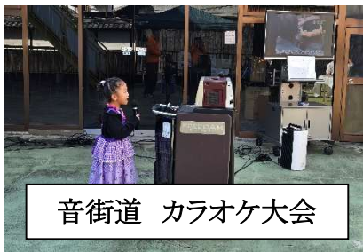
音街道 カラオケ大会