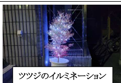
ツツジのイルミネーション