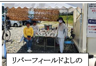
リバーフィールドよしの