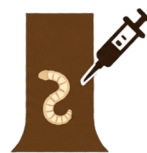
幼虫駆除や薬剤の樹幹注入