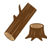
樹勢回復が見込めない桜の伐採