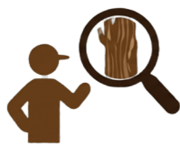
被害木のモニタリング

国・県・町と連携し、吉野山の桜を管理する吉野山保勝会等が中心となり以下の防除・保全対策を実施しています。