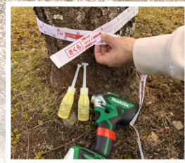
伐採・薬剤注入(リバイブ・ウッドスター)等の防除対策を実施