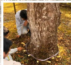
2026年2月末時点で被害木及び周辺の樹木300本以上に薬剤を注入

繁殖力が高く、防除対策を講じないと甚大な被害が予想されます、広大な山肌に植えられた30,000本の桜を病害虫から守るために多額の費用が必要です。日本一といわれ1000年を超えて守り継がれてきた祈りの桜を守るためにご支援をお願いします。