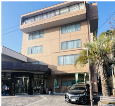
町中央公民館棟 (本庁舎)

庁舎整備等調査特別委員会 令和8年6月8日(月) 町長公室(庁舎・拠点整備推進室)