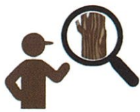
被害木のモニタリング

国・県・町と連携し、吉野山の桜を管理する吉野山保勝会等が中心となり以下の防除・保全対策を実施しています。