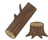
樹勢回復が見込めない桜の伐採