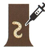
幼虫駆除や薬剤の樹幹注入