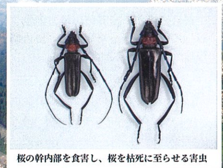
桜の幹内部を食害し、桜を枯死に至らせる害虫

繁殖力が高く、防除対策を講じないと甚大な被害が予想されます、広大な山肌に植えられた30,000本の桜を病害虫から守るために多額の費用が必要です。日本一といわれ1000年を超えて守り継がれてきた祈りの桜を守るためにご支援をお願いします。