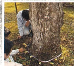
2026年2月末時点で被害木及び周辺の樹木300本以上に薬剤を注入

繁殖力が高く、防除対策を講じないと甚大な被害が予想されます、広大な山肌に植えられた30,000本の桜を病害虫から守るために多額の費用が必要です。日本一といわれ1000年を超えて守り継がれてきた祈りの桜を守るためにご支援をお願いします。