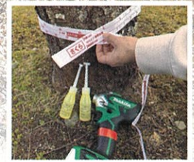
伐採・薬剤注入（リバイブ・ウッドスター）等の防除対策を実施