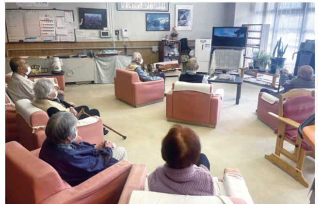
カラオケ機材を設置したホールでの様子

さくら苑ケアハウスでは約30人の入居者様が自立した生活を送っています。食事後にはホールに皆さんが集まって談笑等されていますが、娯楽の要素が不足していると感じ、今年に入ってからカラオケ機材を設置しました。歌うことはストレス発散の効果も高いようで、最近ではホールも以前にもましてにぎわっており、皆さん楽しいひと時を過ごしていらっしゃいます。