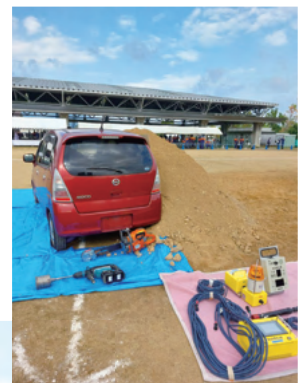
▶▶橿原市で行われた昨年の訓練の様子