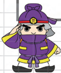
奈良県広域消防組合 マスコットキャラクター 「まほろ隊長」

今年も全国一斉に秋の火災予防運動を実施します。この運動は、皆様に火災予防の意識を高めていただき、火災の発生を防止して尊い生命と貴重な財産を守ることを目的としています。