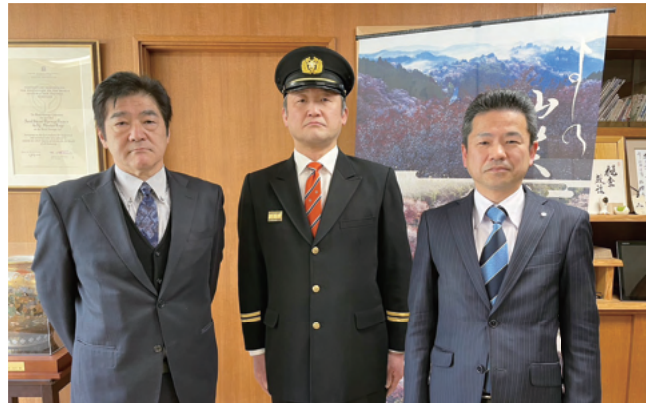
里田前団長 上西新団長 中井町長