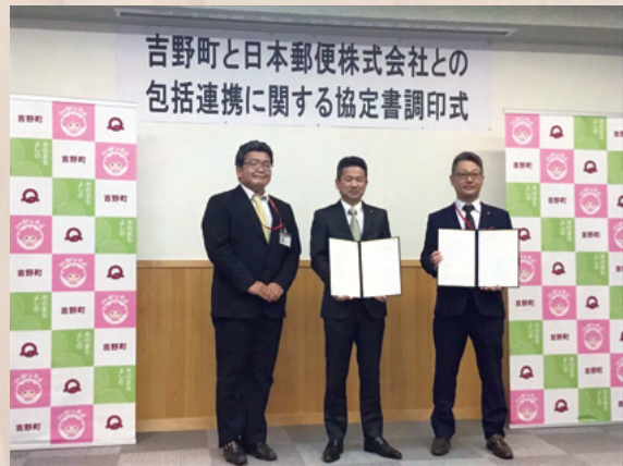
◀ 右から大北竜門郵便局長、中井町長、谷川下市郵便局長

今回の協定は町と日本郵便とが連携・協力を深め、それぞれが有する人的・物的資源を有効活用し、郵便局ネットワークの活用を通じて地域の活性化や住民の安心・安全の