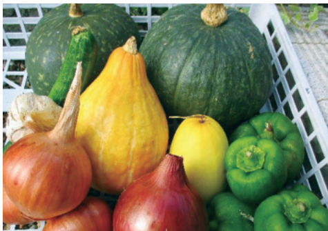
今夏 貸し農園で採れた野菜

なら担い手・農地サポートセンターは、法律に基づき県知事の指定を受けた公的機関です。安心してご利用ください。