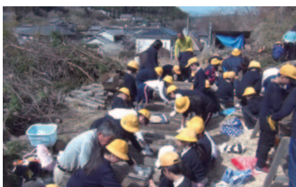
▲吉野小学校の児童との作業風景