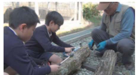
▲吉野北小学校 トンカチを使って菌を植える穴を開けます

町内各小学校の子どもたちと一緒に椎茸の植菌を行いました(写真は昨年の作業の様子)。子どもたちに地元の特産品を知ってもらうことで、自分の口に入るものがどのように作られているのかという、農業や食への関心を高めていってほしいと思います。