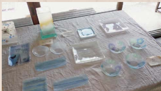
SO-RA 工房 故山田裕子氏のガラス工芸作品

イベントの総合案内のある国栖の里総合センターでは、お弁当の販売やカフェなども実施されました。また、