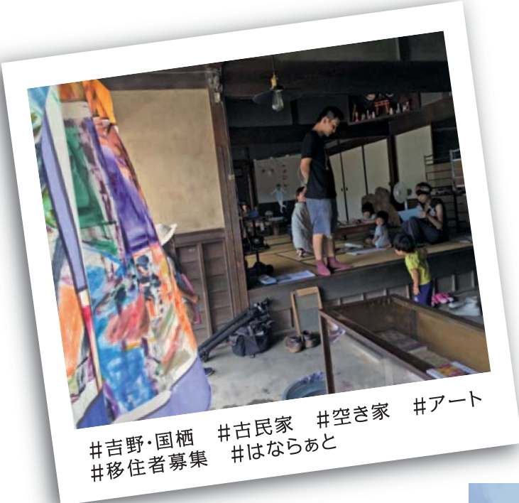
#吉野・国栖 #移住者募集 #古民家 #空き家 #アート #はならあと

この写真は、昨年、国栖の民家でアートイベント「奈良・町家の芸術祭 はならあと」が開催された時のものです。長い間この家は空き家でした。掃除され、芸術作品が展示されると、家が生き生きと呼吸しているようでした。