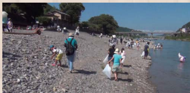
参加者全員で吉野川の河川敷を清掃しました

「～守ろう自然 育てよう吉野川～」を合言葉に開催されたこのイベントは、多くの人々が川遊びや釣りに訪れる美しい吉野川を守るため、水環境の保全の大切さを学んでもらおうと行われ、今回で10回目の開催となりました。会場となった吉野漁協前河川敷には、吉野町・大淀町・下市町の子どもたちやその保護者、約170名が集まり、河川の清掃活動や特設プールでの鮎のつかみ取りなどが行われました。清掃活動で汗だくになった子どもたちは、特設プールの中で水しぶきをあげながら、夢中で鮎を追いかけていました。身近な川の環境を考える、よいきっかけとなったことでしょう。