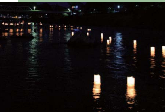
出典 小学館『日本大百科全書(ニッポニカ)』

盆に家々に迎えた先祖を送り帰す行事の一種。あるいは水死者や無縁仏に対する供養行事。初盆の家では飾り立てた精霊船を流し、初盆以外の家では棧俵にろうそくを立てたものを流したりした。一方、水死者や無縁仏の供養は盆に限ったものではなかったが、互いに影響しあうようになった。