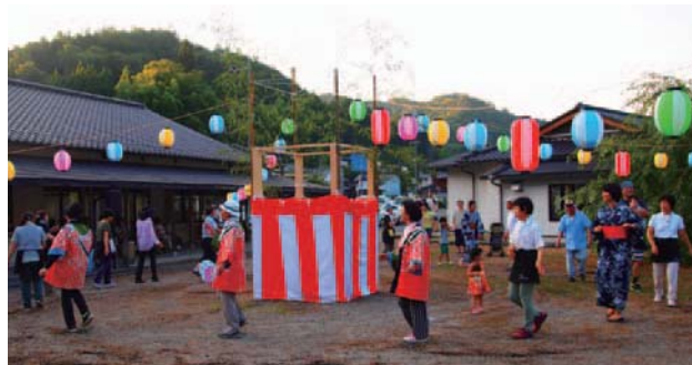
8月5日に行われた中竜門夏まつりでの様子

人と人との交流を深め、活き活きと生きがいをもって暮らすことができる町にしたい、地域の活性化につなげたいと活動を続けて29年になります。最近では活動も軌道にのり、会員も増えました。3年前からは夏まつりを計画し、取り組んでいます。たこ焼き、飲み物、ソフトクリームなどを売り、不足分の資金を捻出し、夏まつりなどのイベントや会員の研修、「市」の宣伝なども行っています。