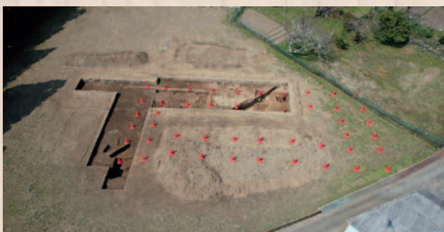
赤い三角コーンは柱跡を示す(南から発掘場所を望む)

※史跡宮滝遺跡…縄文時代から平安時代にかけての複合遺跡で縄文時代後期の土器形式「宮滝式」の標識遺跡。飛鳥時代(齊明朝)～奈良時代(聖武朝)の吉野宮跡として日本史に名を残している。