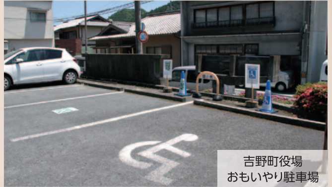
吉野町役場 おもいやり駐車場

制度の詳しいことや、 利用証の申請 は奈良県ホームページ(「奈良県おもいやり駐車場」で検索)をご覧ください。また、奈良県吉野福祉事務所(吉野町中央公民館内)並びに吉野町役場長寿福祉課(Tel.32-8856)にお問い合わせください。