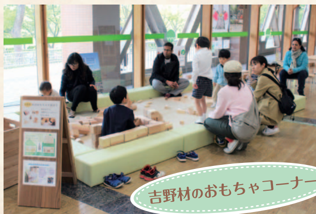
吉野材のおもちゃコーナー

また、それに併せて木の玉プールやファースト・トイなどを開放し、幅広い年齢層の方にご利用頂きました。特に木の玉プールは目を引くらしく、大人の方でも10分以上プールの中で木の玉による足裏マッサージを楽しまれることも珍しくありません。木の香りと感触からくる癒し効果のためでしょう。杣に腰かけて木の香りに包まれる中で来場者同士のコミュニケーションも生まれ、憩いの場となっていました。