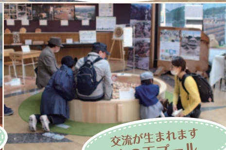
交流が生まれます木の玉プール