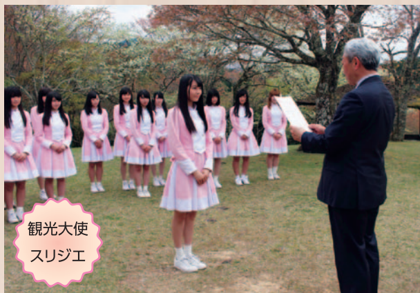
観光大使 スリジエ

AUN J クラシック・オーケストラは、企業と連携し、日本のみならず外国でも桜の植樹や保全活動を行っています。その活動の一環として吉野町には、2009年からCDアルバム「和楽器で桜」の売上の5%を桜の保全のために寄附。また、平成22年には「吉野町観光特別大使」として吉野の桜をアピールし、町内でも数多く演奏をするなど、吉野町と関わりが深いアーティストです。その