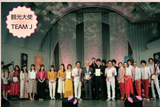
観光大使 TEAM J

仲間でもある、SAMURAI J BAND、NADESHIKO J ENSEMBLE、SAKURA J SOUNDS など「TEAM J」総勢20名で、日本伝統の和楽器と共に、吉野の観光PRを担います。