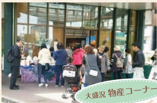
大盛況 物産コーナー

4月2日から5月18日までの期間、大阪・桜ノ宮にある近畿中国森林管理局にて、『魅せる木材・森林展～「林業×地域おこし」の先進地の手法～』というテーマで吉野町をPRする展示を行いました。