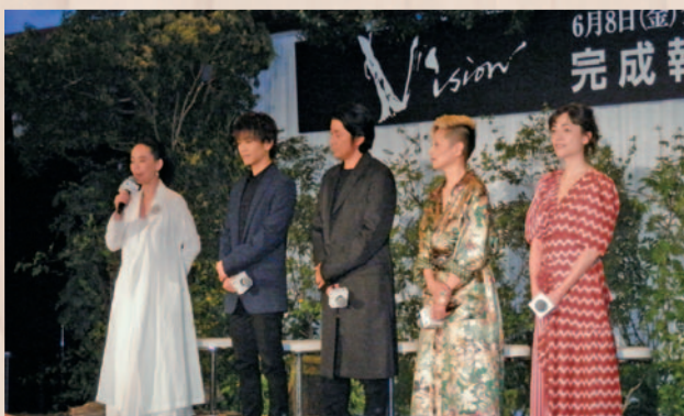
挨拶する河瀬監督(左端)とキャスト

昨年吉野町で撮影された河瀬直美監督の映画「Vision」が完成し、6月8日から全国で公開されます。4月26日には東京で完成報告会見が行われ、映画で使用された切り株などを設置した、吉野の山林をイメージさせるステージで、会見の冒頭に北岡町長が吉野町代表として挨拶しました。町長は、映画の完成を祝うと共に、映画を通して伝わる吉野の魅力をインバウンドにつなげたいと話しました。奈良県内では、ユナイテッド・シネマ橿原他で上映されます。