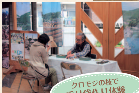
クロモジの枝で香り袋作り体験