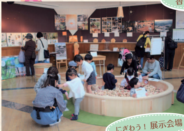
にぎわう！展示会場

古くは大阪城建築に吉野の木が使われたという縁の深い街ではありますが、「木はいいけど、高い」というイメージを持つ方が多いようです。一方で、病気や環境問題に対する社会的関心が高まる中、生活空間に木を取り入れることが健康管理や環境保全に寄与するということを示す科学的なデータが増えてきています。