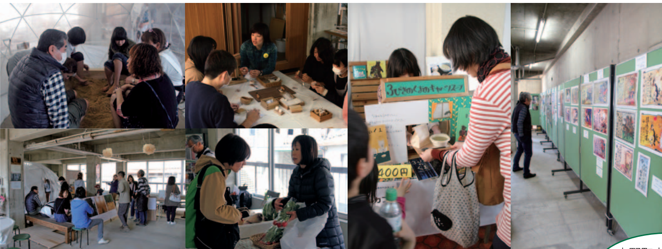
吉野町内の空き家が撮影場所に利用されました