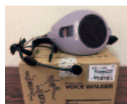
ハンズフリー拡声器