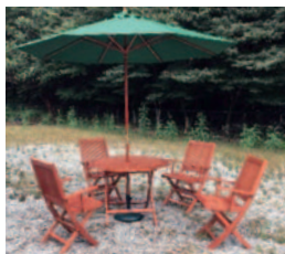
屋外用テーブルチェアセット