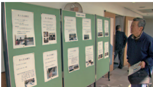
公民館サークル活動の紹介の展示