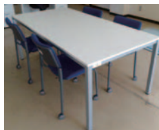
ミーティングテーブル・チェア