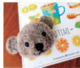
作成例 毛糸のマスコット