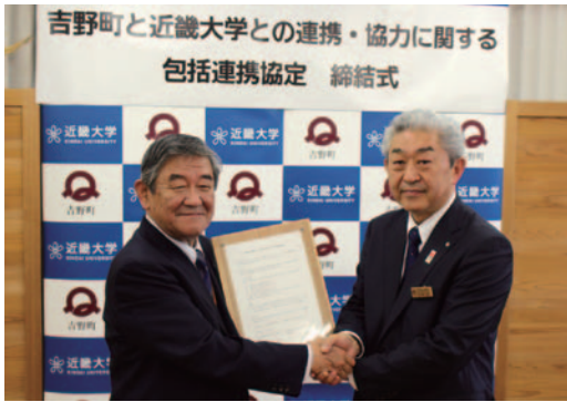
近畿大学増田副学長と北岡町長