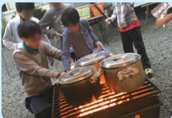
《アウトドアクッキング》