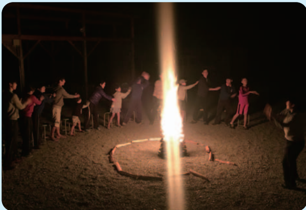
《キャンプファイアー》

上述の団体を含め、ご利用頂いた方々からは野外学校での行事が成功裏に終わり、「また、来年も利用したい。」というお言葉を頂きます。これもひとえに、自然豊かな吉野宮滝の風土と地域の方々の支えの賜物であると感じております。