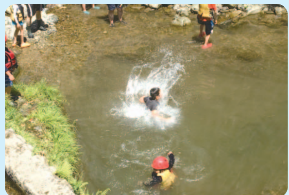
《喜佐谷川での川遊び》