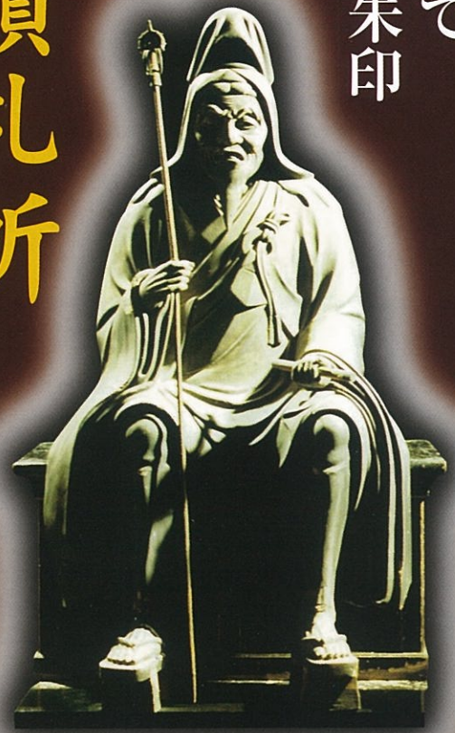
修験道開祖 役行者