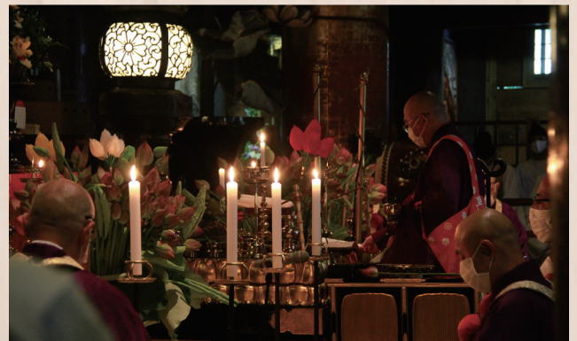
多くの蓮の花が供えられた蔵王堂内で法要が営まれました